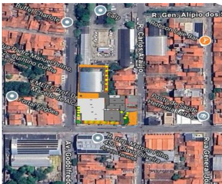
Figura 1 - Planta Implantação Proposta.

3.2.3. A obra torna-se necessária em caráter de urgência, pois diversas áreas da escola, e principalmente sua estrutura, encontram-se com danos estruturais e com regiões degradadas colocando em risco as crianças e adolescentes que frequentam o espaço, assim como os profissionais que trabalham no equipamento e toda a população que a utiliza, de forma direta ou indireta.