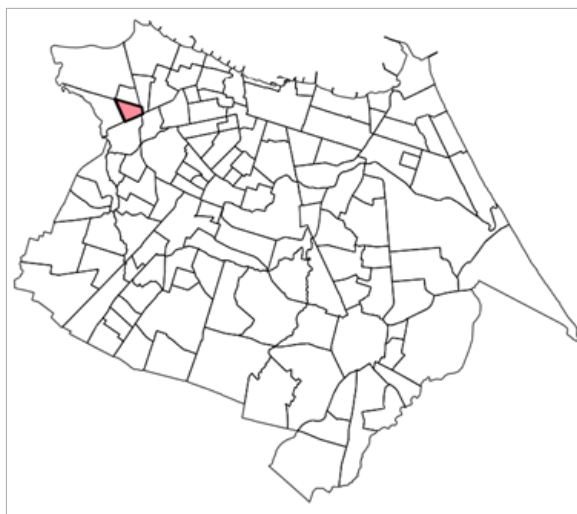
Figura 1 – Localização do bairro Olavo Oliveira

EDITAL Nº 11195 | PROCESSO ADM. Nº P033030/2026 CONCORRÊNCIA ELETRÔNICA Nº 90011/2026 | UASG: 927744