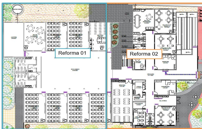
Figura 3 – Planta baixa proposta.

3.3.2. As intervenções serão realizadas seguindo todos os critérios técnicos, normativos e legais, priorizando a qualidade, funcionalidade e durabilidade da nova estrutura. A reforma busca tornar a Escola Prof. Denizard Macedo um ambiente mais moderno, acolhedor e alinhado às demandas contemporâneas da educação.