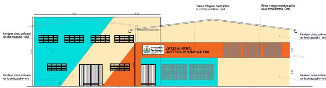
Figura 2 -Fachada proposta - Fonte: SEINF-COPROJ.

3.3.1. O novo projeto contempla a reconstrução e ampliação de ambientes escolares, com ênfase na modernização do setor administrativo e na organização de espaços que favoreçam o desenvolvimento das atividades educacionais. Além disso, a reforma incluirá a criação de uma área de lazer e playground, destinados a acolher as crianças em momentos de recreação. Estes espaços serão planejados para oferecer segurança, acessibilidade e estímulo ao convívio social, promovendo o bem-estar e o desenvolvimento integral dos alunos. Abaixo segue uma ilustração proposta para a fachada: